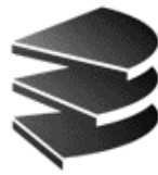
(a) Altes DBS-Logo.