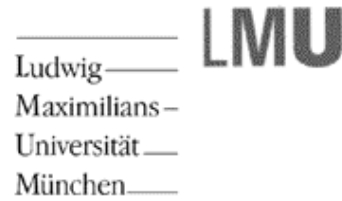
(b) Uraltes LMU-Logo.